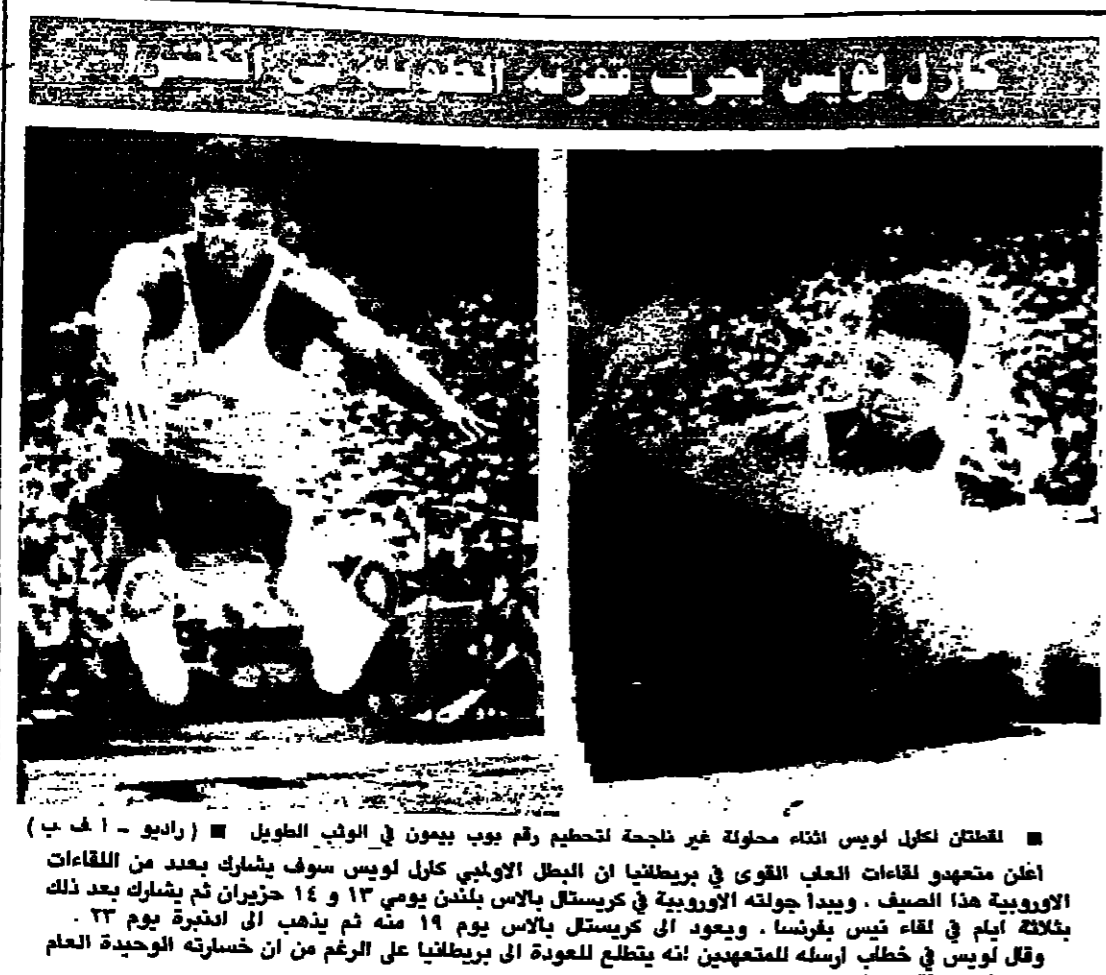
المعتاد لكارل لويس اثناء محوطة غير تلحظة التحطيم رقم بوب بيرون في الوبس الطويل (راديو - ا ف ب)